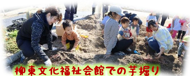
柳東文化福祉会館での芋掘り