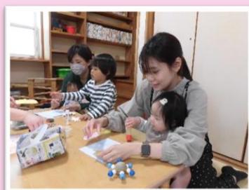
はじめましての会